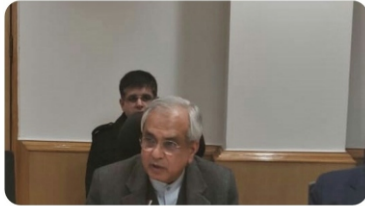
PMO India and 9 others