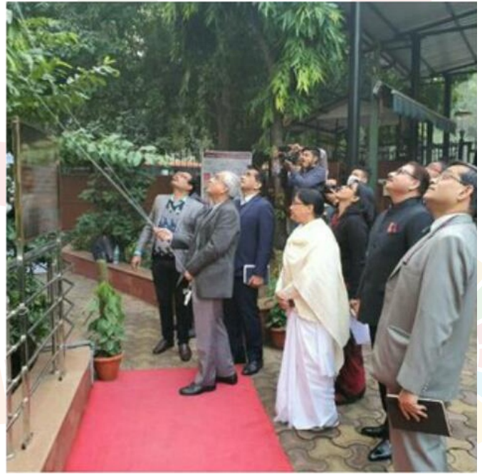
Launch SDGChoupal 2030 at NitiAayog ,Chaired by VC NitiAayog Sh Rajiv Kumar joined by CEO NitiAayog Sh Amitabh Kant and other important dignitaries