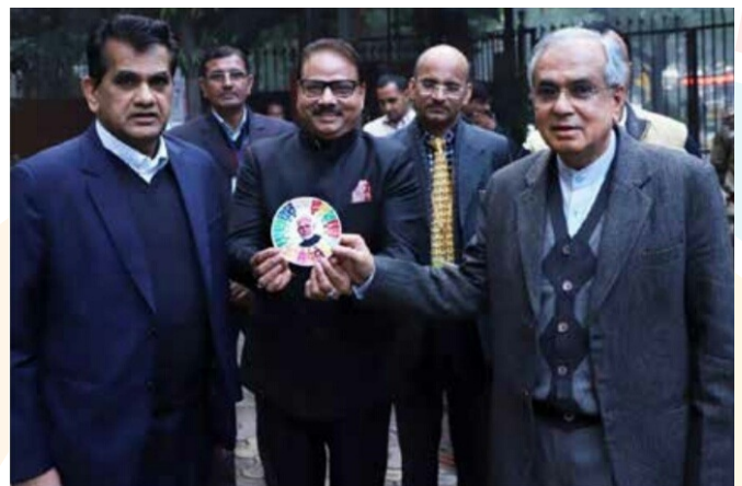
Launch of SDG sticker