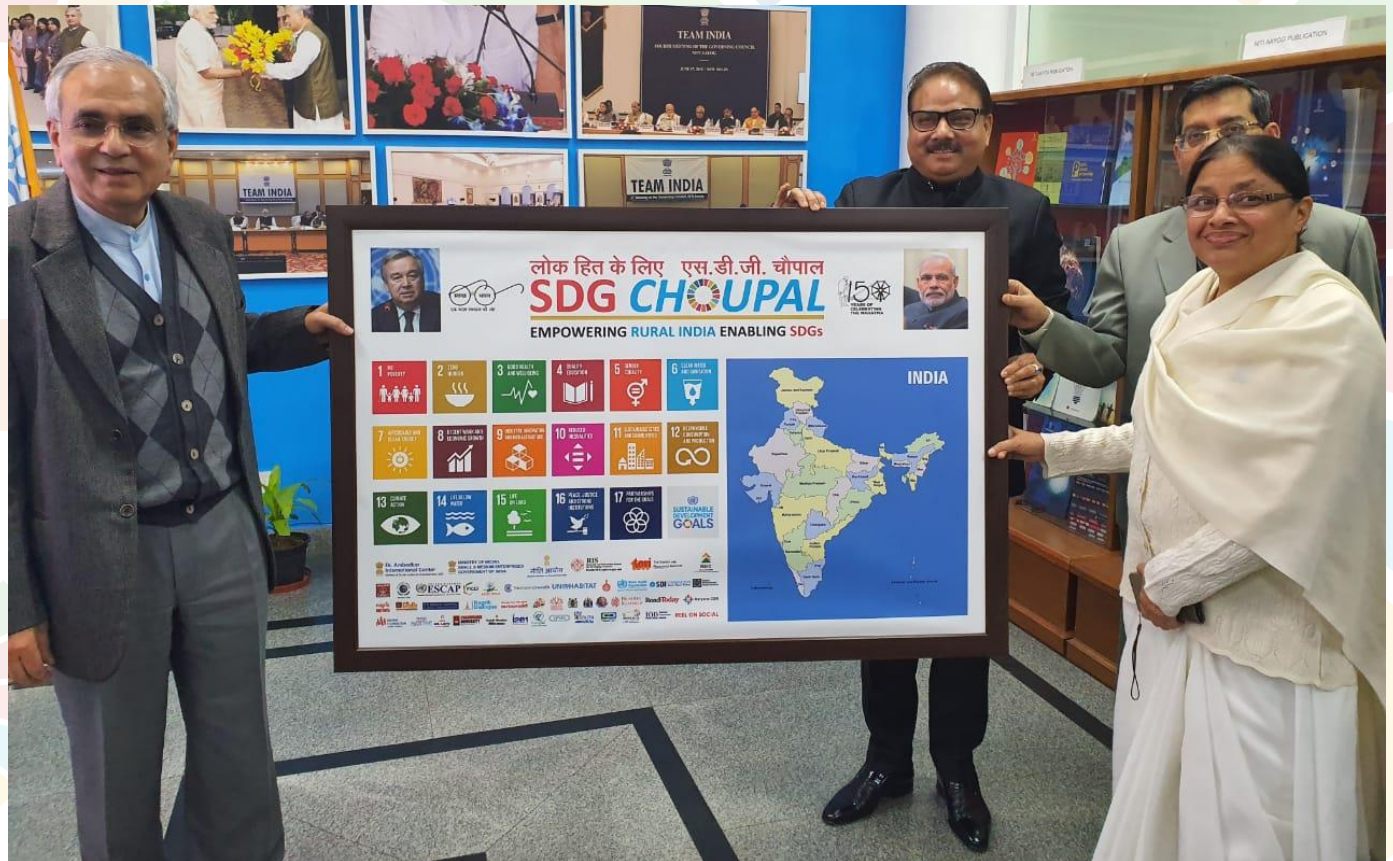
Launch of SDG Poster by VC NitiAayog