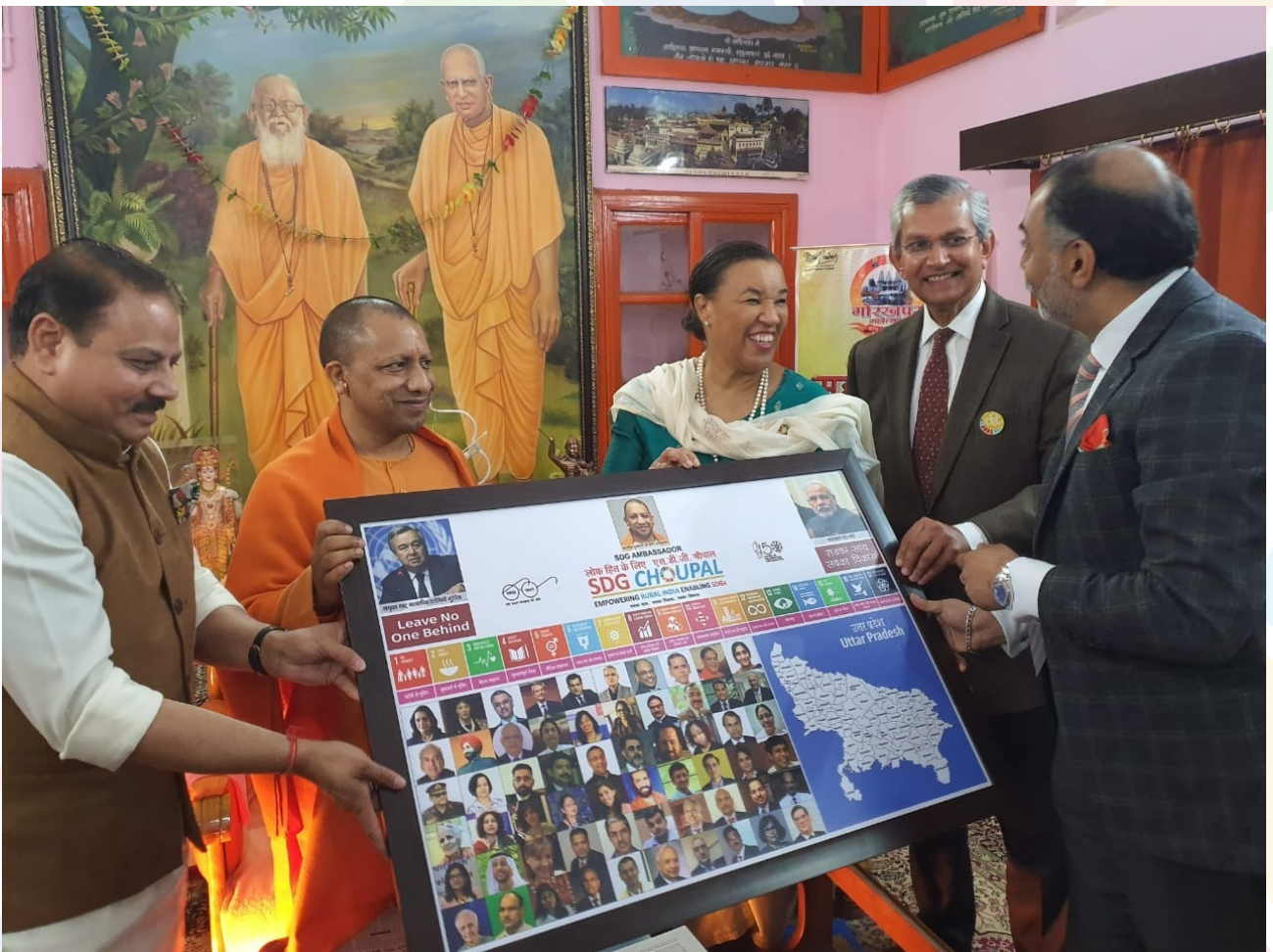
With Hon'ble CM Sh Yogi Adityanath jee at Gorakhpur ,SDG Ambassador Honour