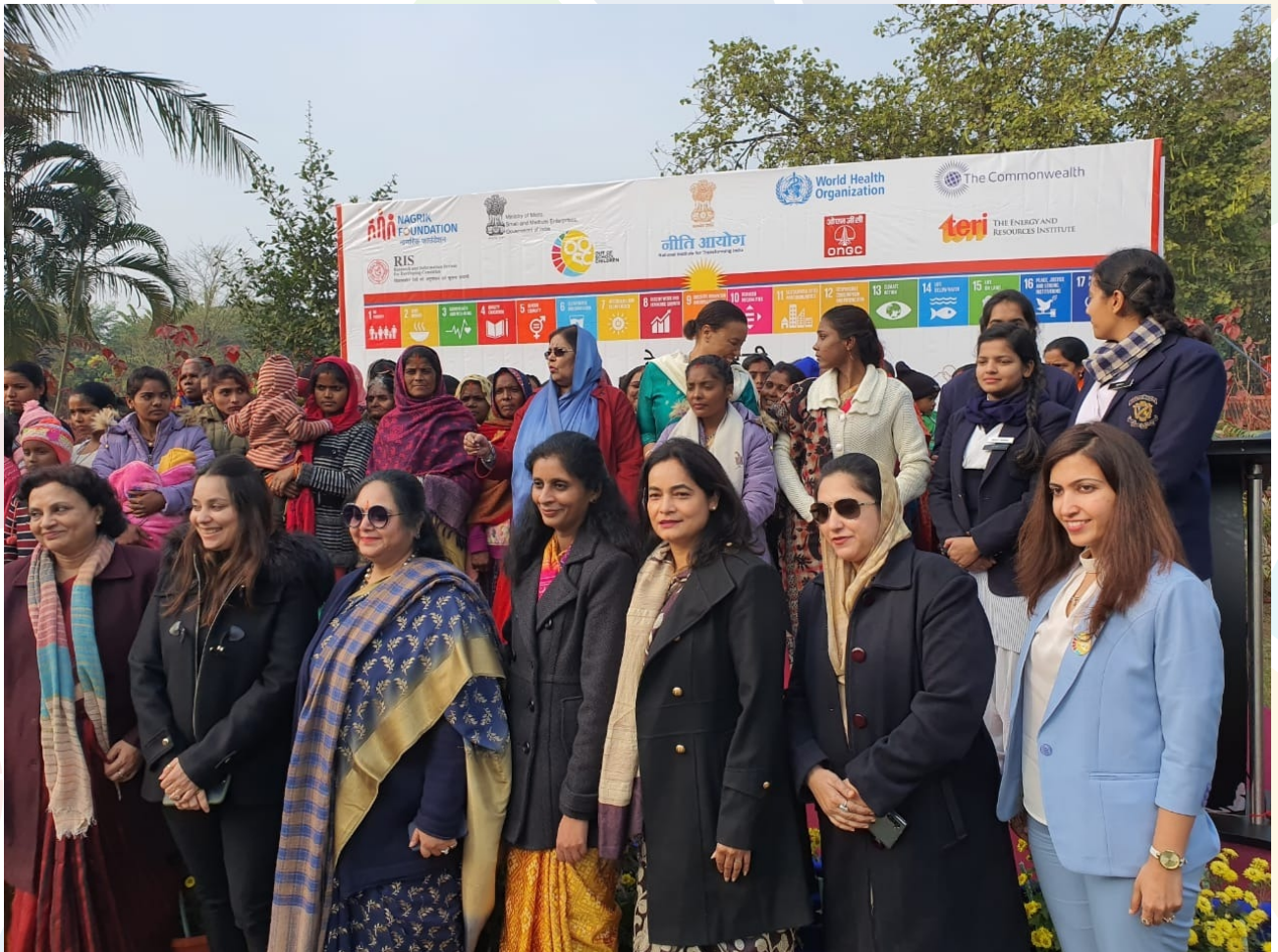
First SDGChoupal on ground at Gorakhpur blessed by presence of Secy General Commonwealth Secretariat London Baroness Patricia Scotland