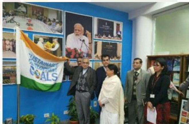
Launch of SDG Flag