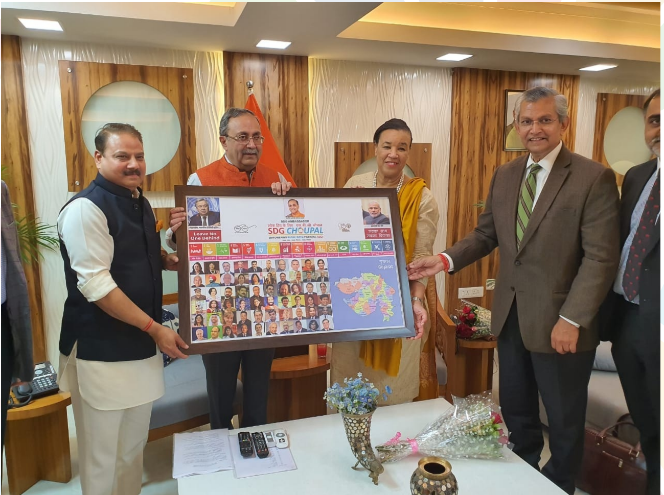
At Ahmedabad with State Leadership ,SDG Ambassador award for Hon'ble CM Sh Vijay Rupani jee