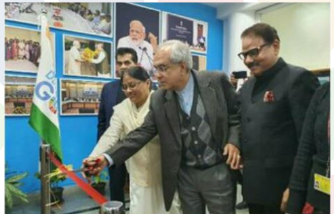
Launch of SDG SankalpJyoti