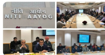
PMO India and 9 others

#SDGs के लक्ष्यों को हासिल करने में यह चौपाल सूत्रधार की भूमिका निभाएगा जिस से हर घर, हर गाँव, हर नगर तक पहुंचेगी विकास की लहर।