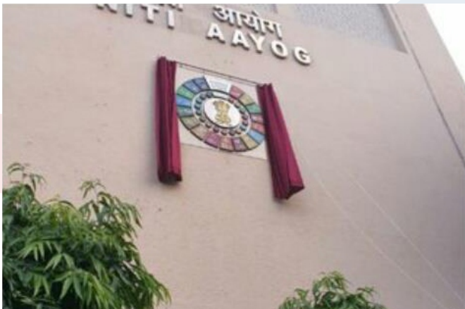
Launch of SDG Insignia