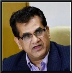
SH. AMITABH KANT

" India will succeed in its SDG Goals only when we have mainstreamed them not only in our govt policy but also in our societal make up and that's where we have to make this initiative go a long way . "