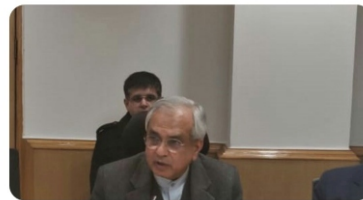
PMO India and 9 others