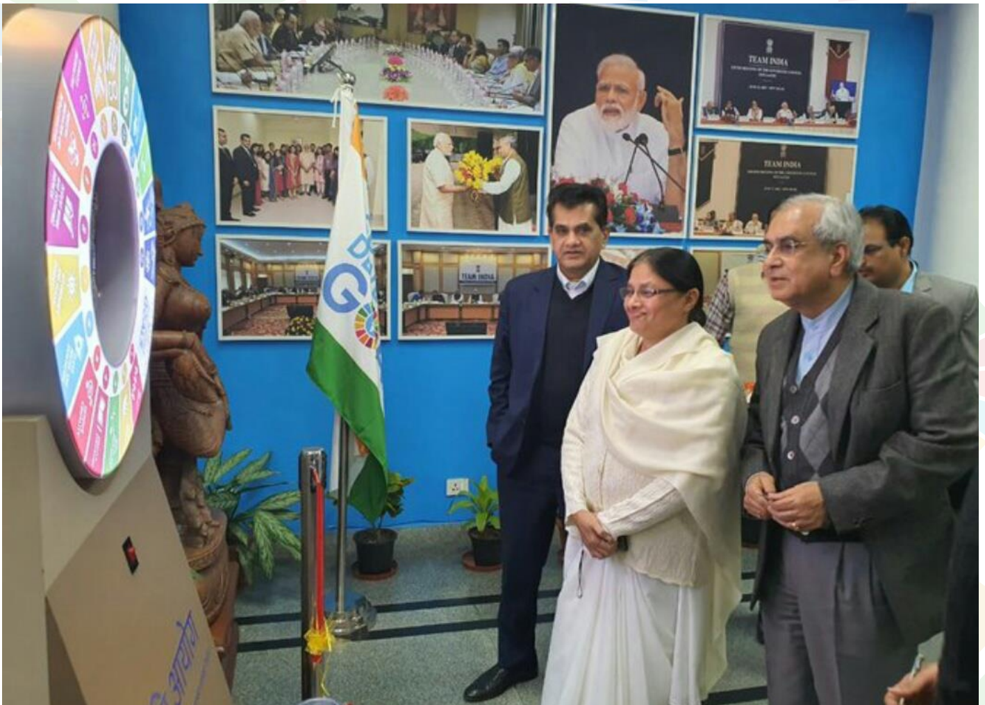
Launch of SDG Sankalp Jyoti inspiration for the world ,Leaving No One Behind mission Sabka Saath Sabka Vikas