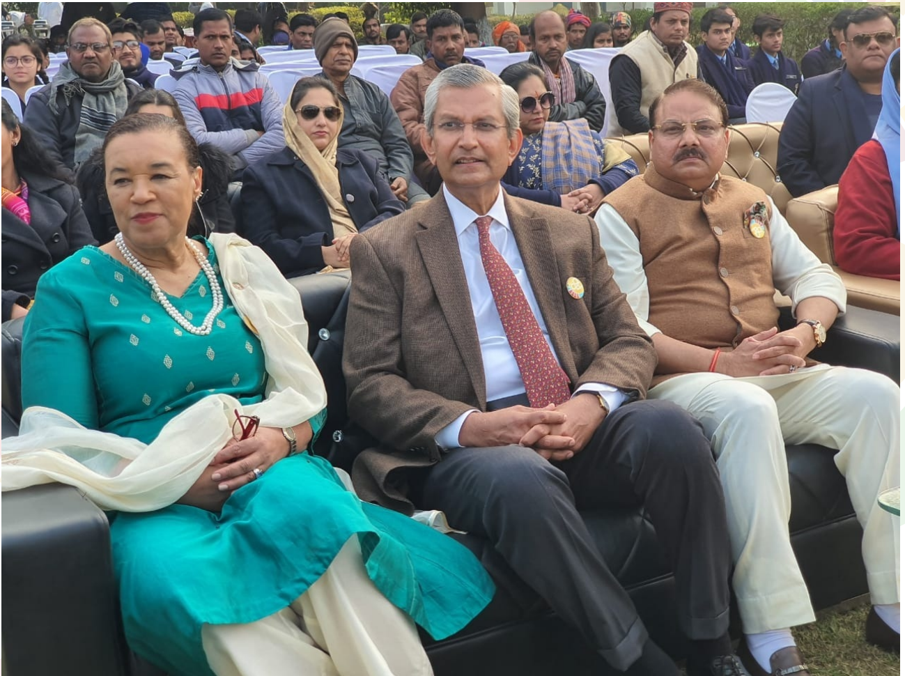
SDGChoupal at Gorakhpur in progress